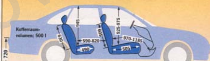
Opel Vectra Stufenheck

Auf den Millimeter genau vermessen: links die Fließheck-Limousine, rechts das Modell mit Stufenheck. Platzunterschiede gibt es kaum