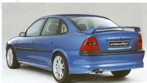
Heckflügel i 29 01 425, Heckschürzenlippe i 29 01 451.