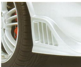
Markant: Spoilerstößtange i 29 01 030 mit seitlichen Lüftungsschlitzen.