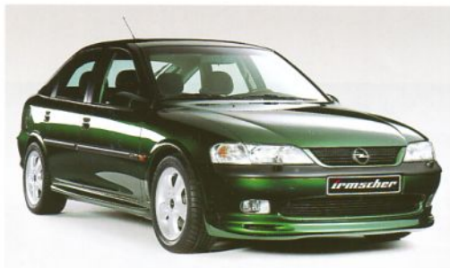
Frontspoilerlippe i 29 01 003 zum Anbau an die Serienstoßstange.