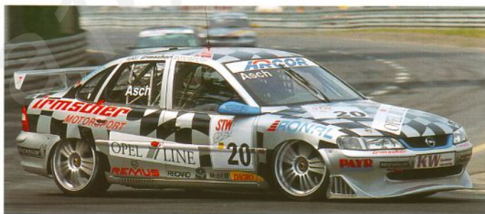
Optische Ähnlichkeit nicht unbeabsichtigt – Irmischer STW-Vectra.

Sowohl unter aerodynamischen als auch unter optischen Gesichtspunkten bilden Heckflügel und Heckschürzenlippe den gelungenen Abschluß des sportlichen irmscher LINE Stylingkonzepts für die Vectra Modellvarianten Fließheck und Stufenheck.