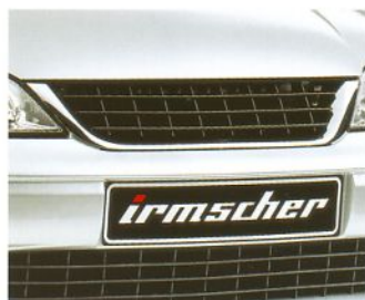
Sportiv: Kühlergrilleinsatz i 29 01 057 im Gitterdesign.