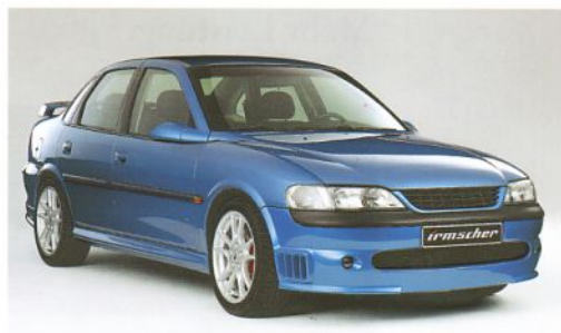
Spoilerstoßstange i 29 01 011, Kühlergrilleinsatz unten i 29 01 052.

Die individuellen Karosserieteile für die Front- und Heckpartie des Vectra stehen optisch im Einklang mit der Karosserielinie des Fahrzeugs und unterstreichen die sportlichen Ambitionen des Fahrers.