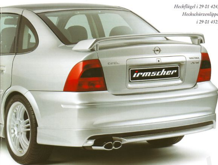
Heckflügel i 29 01 424, Heckschürzenlippe i 29 01 452.