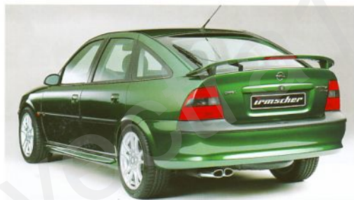
Heckflügel i 29 01 406 mit integrierter 3. Bremsleuchte in rot.