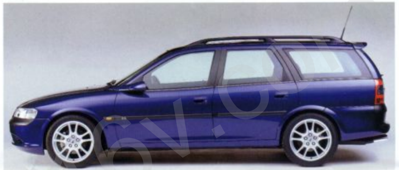
Sportliche Linienführung durch Spoilerstoßstange i 29 01 001 und Dachspoiler i 29 01 404.

Am Heck des Fahrzeuges setzt der OPEL i LINE Nachschalldämpfer mit verchromtem, ellipsenförmigen Doppel-Endrohr den entsprechenden Akzent.