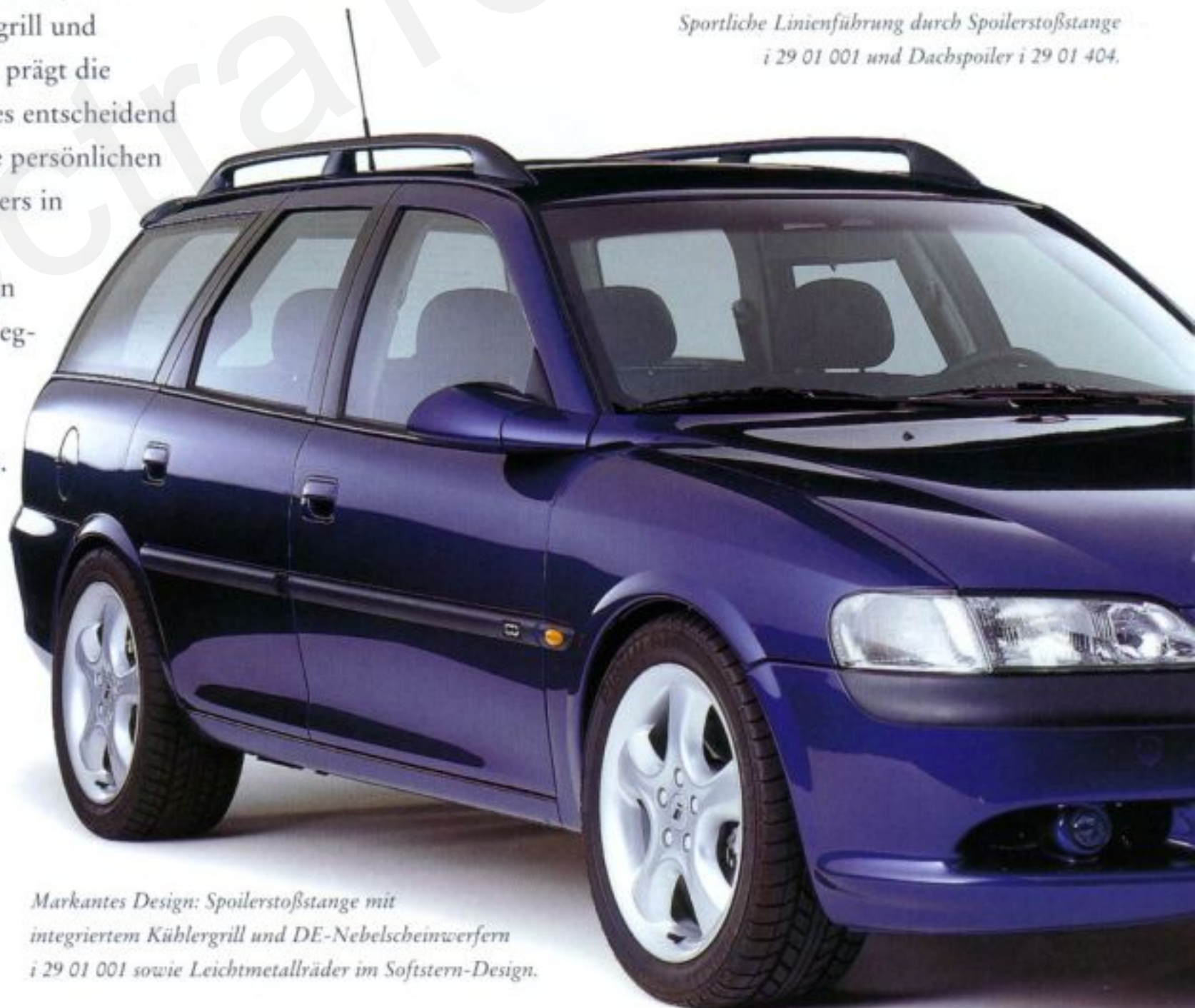
Markantes Design: Spoilerstoßstange mit integriertem Kühlergrill und DE-Nebelscheinwerfern i 29 01 001 sowie Leichtmetallräder im Softstern-Design.