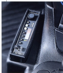
Abb. unten: griffgünstig am Mittelunnel – das Funkgerät

Als Funkverrüstung kann für das Funkgerät Bosch KF 168 eine Halterung am Mittelunnel auf der Fahrerseite geliefert werden. Die werkseitige Vorrüstung erfolgt inklusive Lautsprecher und Antennenkabel bis zum Kofferraum.