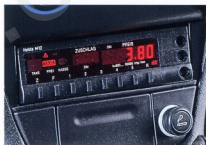
Abb. oben: Taxameterverrüstung in der Mittelkonsole