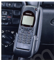
Abb. oben: Halterung für D-Netz-Handy auf Wunsch