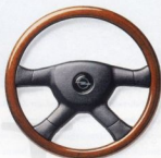
Vier-Speichen-Holzlenkrad , 17 45 504, Durchmesser: nur 37 cm, wertvolles Mahagoniholz mit Leder. Pralltopf (Adapter) zur Montage erforderlich, 17 45 541.

Damit Sie sich in Ihrem Vectra rundum wohl fühlen und genauso sicher wie entspannt unterwegs sind, können Sie seine anspruchsvolle Innenausstattung durch Zubehör-Artikel perfekt auf Ihre individuellen Bedürfnisse zuschneiden. Am besten fahren Sie dabei, wenn Sie Original-Zubehör von Opel wählen. Das paßt haargenau und zeichnet sich durch ansprechende Ästhetik und hohe Funktionalität aus.