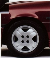
Leichtmetallrad , 17 50 327, 6 J x 15, mit ABE. Farbe: Silber, Zierkappe für Radnabe.