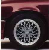
Leichtmetallrad , 17 50 322, 6 J x 15, mit ABE. Farbe: Titan, Zierkappe für Radnabe und Abdeckkappen für Radschrauben.

Hier sehen Sie das vielseitige Programm für den individuellen Auftritt Ihres Vectra: Opel Leichtmetallräder. Die Varianten zeigen eine breite Palette vom sportlichen bis zum eleganten Leichtmetallrad. Ästhetische Highlights, ganz nach Ihrem Geschmack. Jedes einzelne Rad wurde unter härtesten Testbedingungen entwickelt und bietet somit ein Optimum an Sicherheit und Qualität.