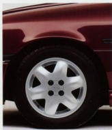
Leichtmetallrad , 17 50 313, 5 1/2 J x 14, mit ABE. Farbe: Silber, Zierkappe für Radnabe und Abdeckkappen für Radschrauben.