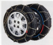
Schneeketten, 17 91 630/634, aus spezialgehärtetem Edelstahl, einfachste Montage mit Bügelverschluß, auch am festsitzenden Fahrzeug.