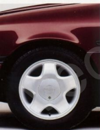
Leichtmetallrad , 17 50 326, 5 1/2 J x 14, mit ABE. Farbe: Silber, Zierkappe für Radnabe und Abdeckkappen für Radschrauben.