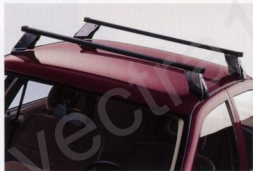
Dachgepäckträger-Galerie, 17 32 438, für Dachlasten. Leichte Montage. Nur in Verbindung mit Basisträger.