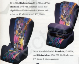
Ohne Vorstellisch sind Sitzschale, 17 46 726, und Rückenlehne, 17 46 727, für Kinder von 3 1/2 bis zu 6 Jahren geeignet.