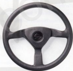
Drei-Speichen-Lederlenkrad , 17 45 508, hochwertiger, besonders griffiger Echtlederbezug. Zur Montage ist der Pralltopf (Adapter), 17 45 541, erforderlich.

Die perfekte Kombination aus High-Tech und exklusiver Innenausstattung. Unter ergonomischen Aspekten angeordnete Instrumente und Bedienelemente, eingebettet in wertvolles Wurzelholz. Die Wurzelholz-Armaturentafel , 17 53 601, 4 elegante Türholzleisten , 17 53 500, Wurzelholz-Schalthebelknopf , 17 53 800, sowie Wurzelholz-Ascherdeckel , 17 53 602, setzen geschmackvolle Akzente.