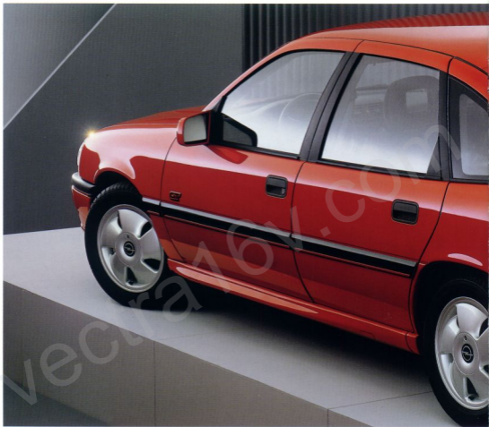
Der Vectra GT 16V

Erleben Sie Fahrfreude und Fahrsicherheit in idealer Kombination. Das straff abgestimmte Fahrwerk mit Gasdruck-Stoßdämpfern, Scheibenbremsen vorn und hinten, vorn innenbelüftet, ein 5-Gang-Sportgetriebe und besonders der 16V-Motor sorgen für das richtige