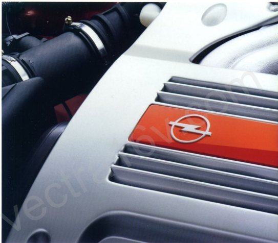
Das Triebwerk des Vectra V6. 24 Ventile, 2,5 Liter, 125 kW (170 PS).

Opel Ingenieure haben einen überraschend kompakten 6-Zylinder-Motor konstruiert. Im Vectra feiert er Premiere. Der Vectra V6 ist temperamentvoll und kultiviert zugleich. Die neue Bosch-Motronic M 2.8 optimiert Durchzugskraft und Verbrauch. Besonders glänzt hier der neue V6-Motor mit Bestwerten: Er ist einer der sparsamsten seiner