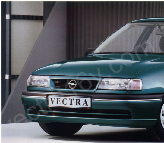
Der Vectra GLS.

Der Vectra GL eröffnet Ihnen den Einstieg in die Vectra-Klasse. Zahlreiche funktionelle Detailverbesserungen sowie die hochwertige Ausstattung sorgen für sinnvollen Komfort.